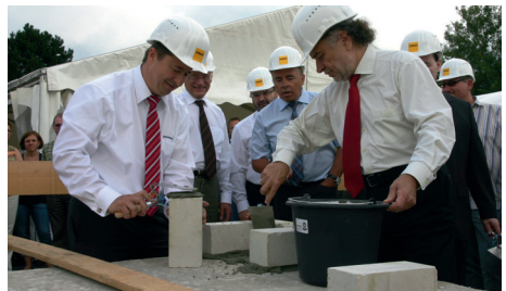
23.8.2011: Grundsteinlegung für Technikum Zeppelin