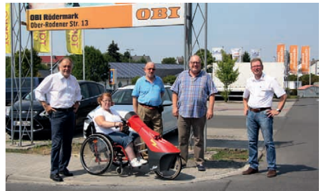
Bordsteinabsenkung Parkplatz OBI/ Kaufland