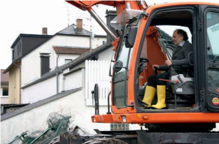
P&R-Anlage Bahnhof Ober-Roden