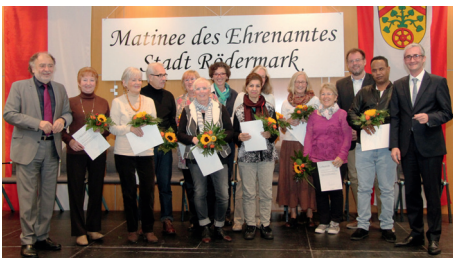
Ehrenamtsmatinee am 23.10.2016