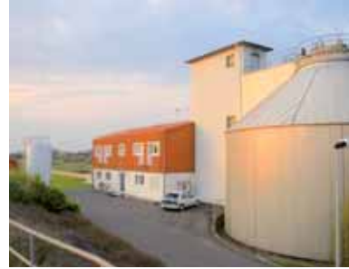
Bestehende Biogasanlage in der Kläranlage Ober-Roden

Durch den Einsatz moderner Techniken muss unsere Kläranlage zukünftig weiter verbessert werden, eine Investition in die Zukunft, für die wir uns einsetzen. Altlasten in unseren Böden werden über kurz oder lang zu einer erheblichen Belastung für die Menschen und ihre Umwelt auch hier in Rödermark. Deshalb setzen wir uns für die Aufstellung und sukzessive Umsetzung eines Sanierungsplanes für alle Altlasten ein.