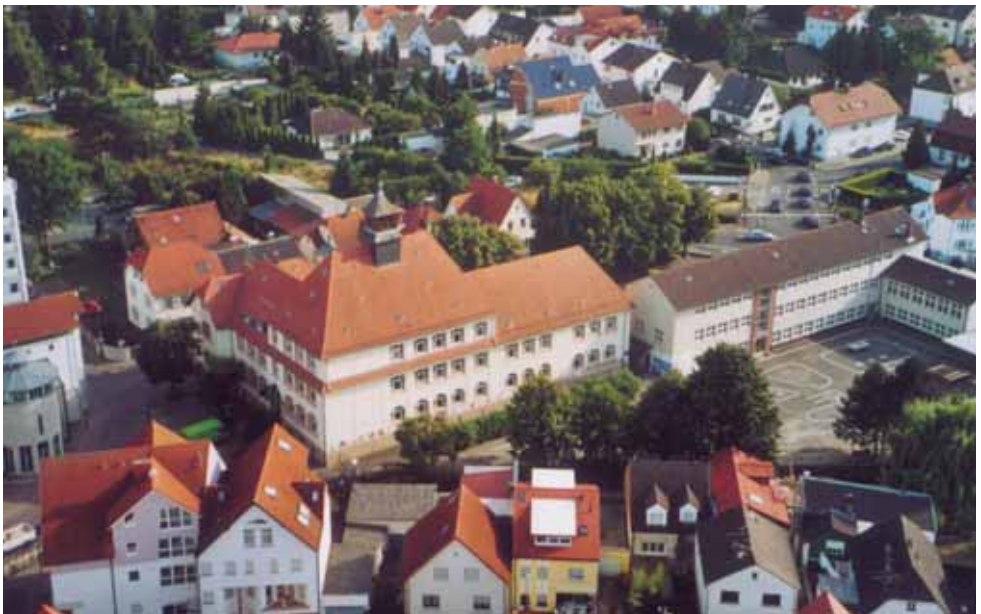
Trinkbornschule aus der Vogelperspektive